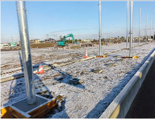
石仏公園整備工事 ゼロ災害で進行中