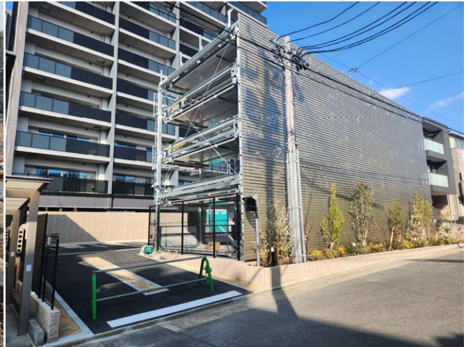
モアグレース弥富通新築工事 ゼロ災害で完了