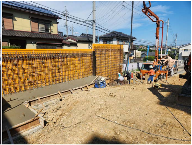
OH!坂 新築工事 ゼロ災害で進行中