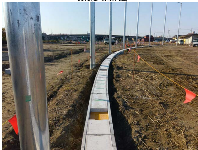
石仏公園整備工事 ゼロ災害で進行中