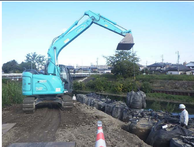
喜惣治橋補強工事 ゼロ災害で進行中