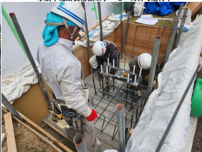
瀬戸信用金庫看板基礎工事 ゼロ災害で進行中