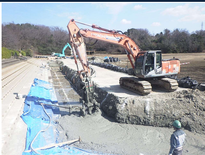
水広下池耐震補強工事 ゼロ災害で進行中