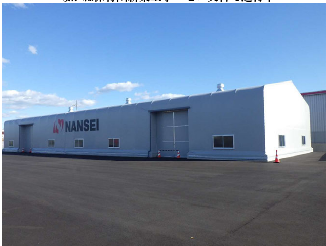
南星キャリアックス(株) テント倉庫設置工事 ゼロ災害で完了