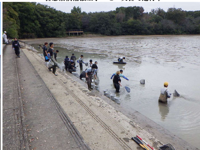
水広下池耐震補強工事 ゼロ災害で進行中