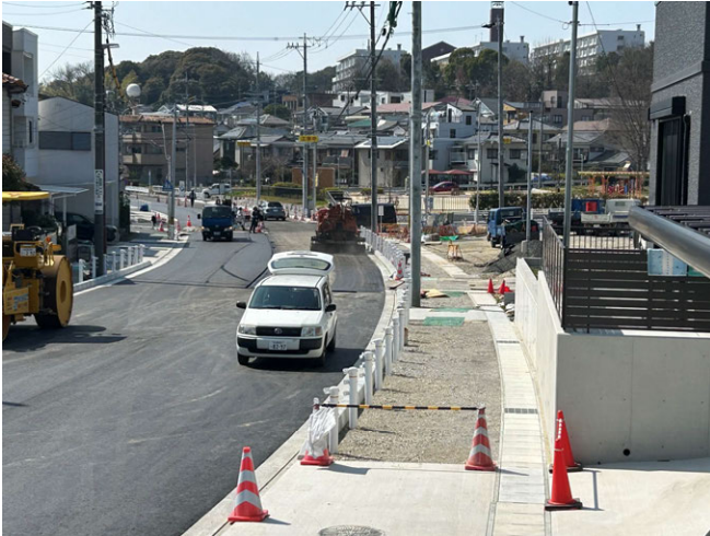
山の手通線街路築造工事(その5) ゼロ災害で進行中