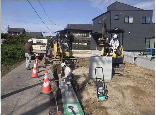
知多市八幡側溝工事 ゼロ災害で進行中