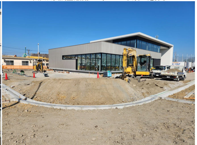
名古屋港湾労働者福祉センター外構工事 ゼロ災害で進行中