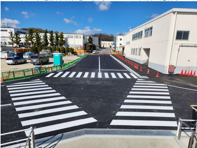
旭サナック外構工事(2期) ゼロ災害で進行中