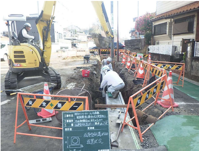
山の手通線街路築造工事(その5) ゼロ災害で進行中