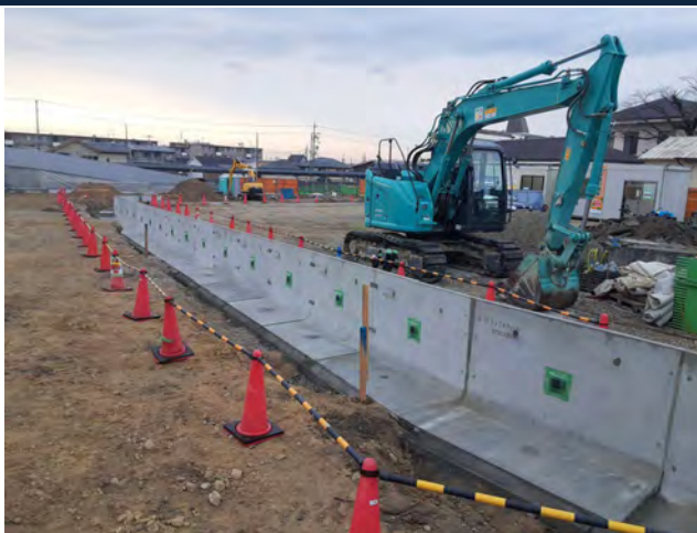
旭サナック外構工事(2期) ゼロ災害で進行中