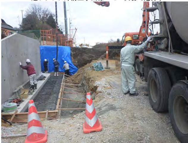
山の手通線街路築造工事(その5) ゼロ災害で進行中