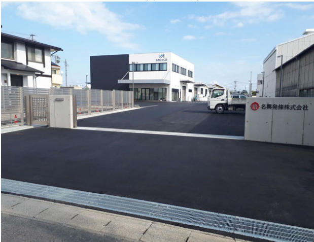
名興発条工場増築工事 ゼロ災害で完了