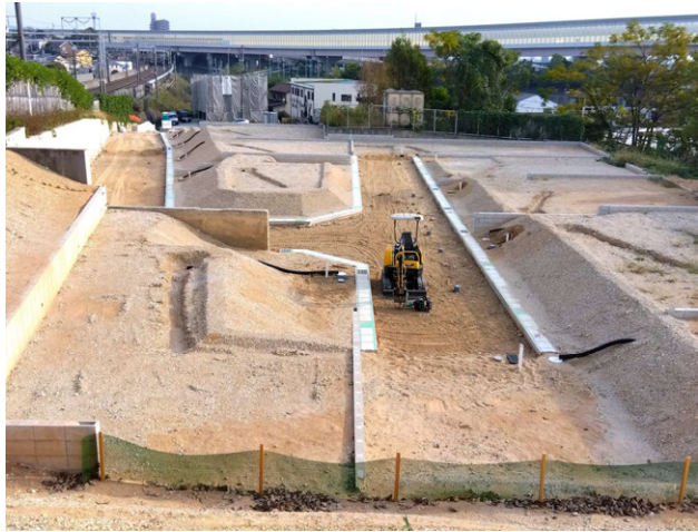
緑区清水山開発工事 ゼロ災害で進行中