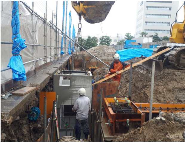
旭サナック共同溝工事 ゼロ災害で進行中