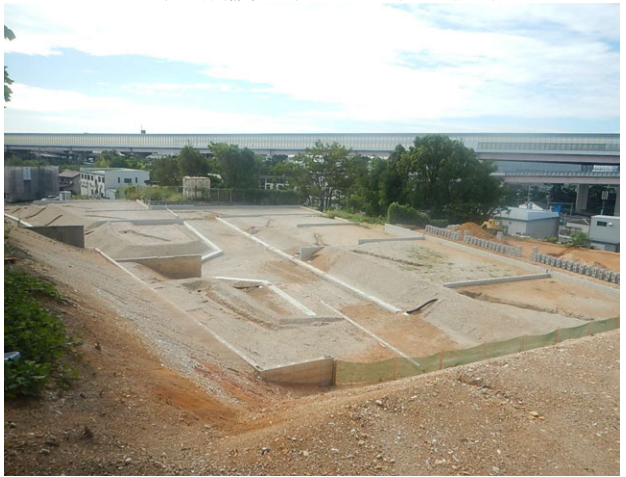
緑区清水山開発工事 ゼロ災害で進行中