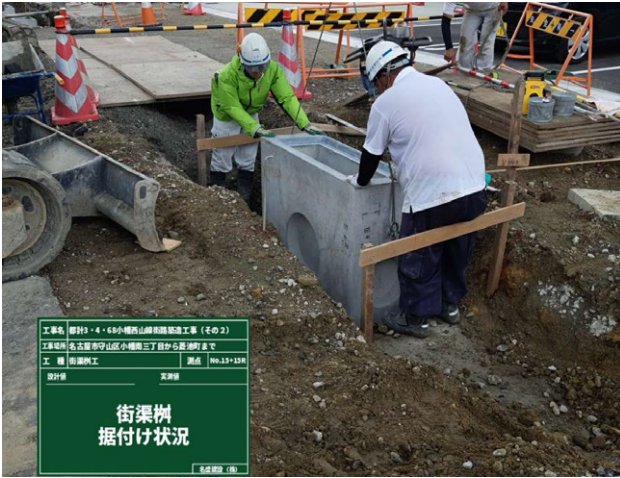
小幡西山線街路築造工事(その2) ゼロ災害で進行中