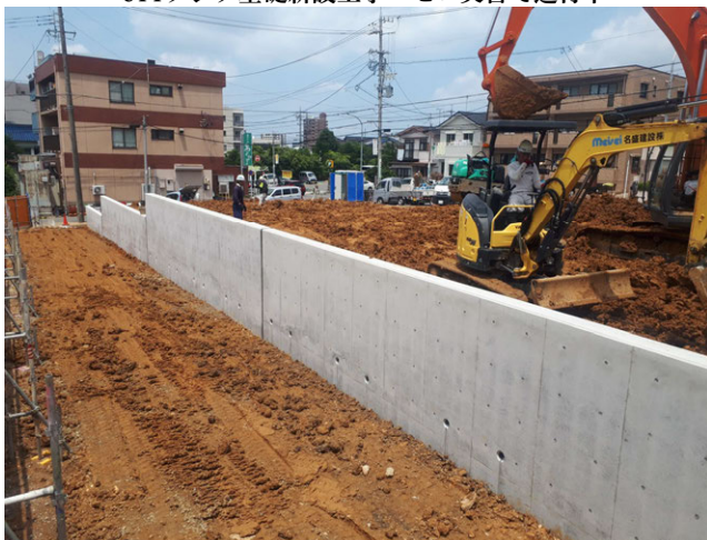
珈栄舎外構工事 ゼロ災害で進行中