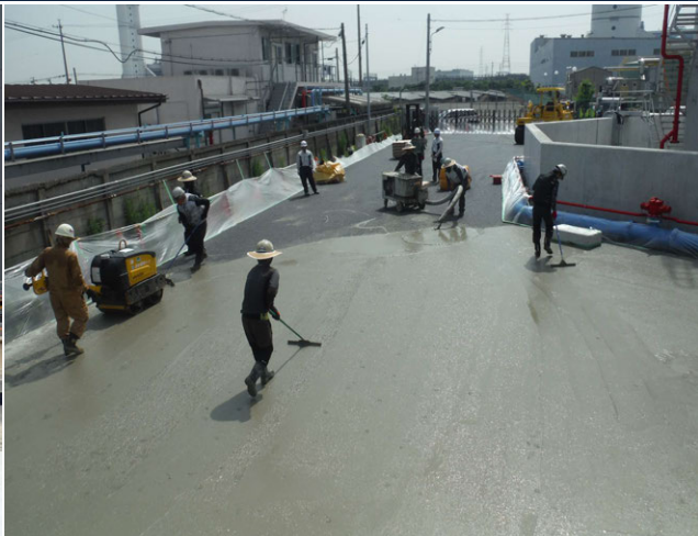
CTTタンク基礎新設工事 ゼロ災害で進行中