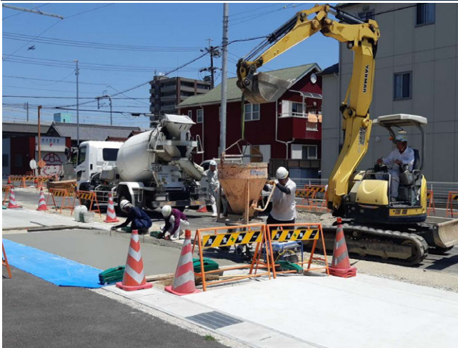
小幡西山線街路築造工事(その2) ゼロ災害で進行中