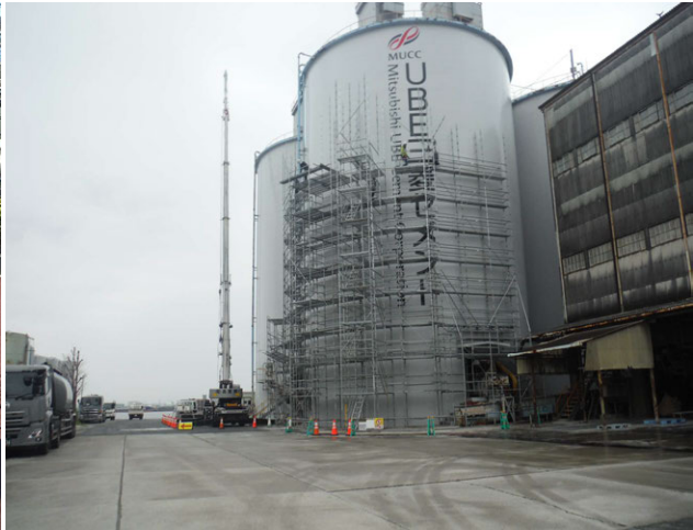
空見SS4号サイロ補修工事 ゼロ災害で完了