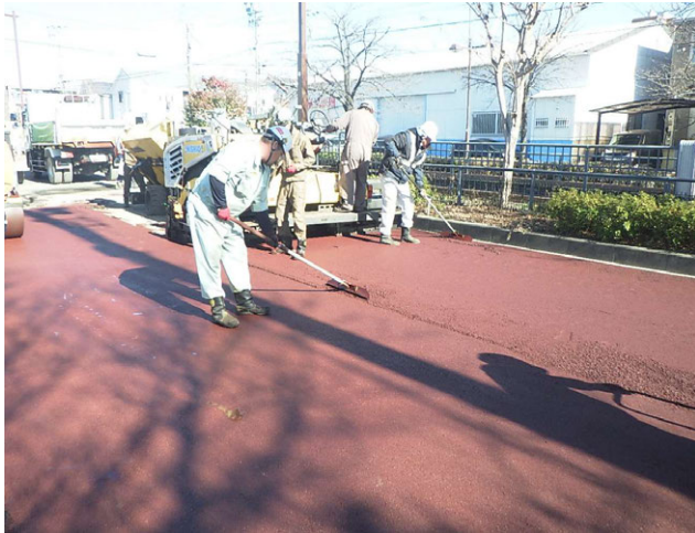
舗装道修繕工事A (天白-2) ゼロ災害で進行中