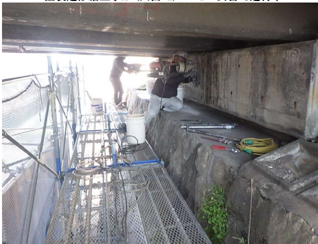
新橋(昭和)補強及び補修工事 ゼロ災害で進行中