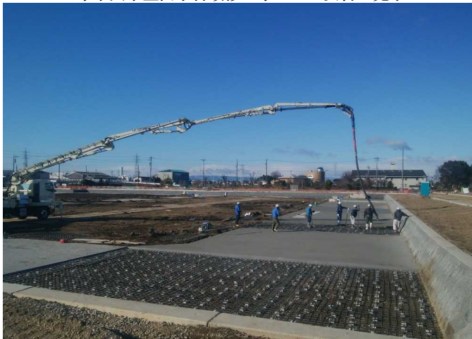
岩倉用地造成事業 ゼロ災害で進行中