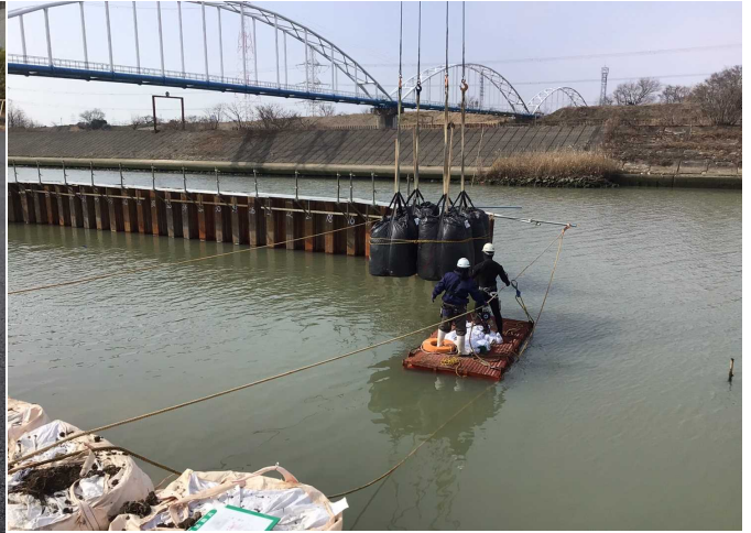
逢妻川河川工事 ゼロ災害で進行中