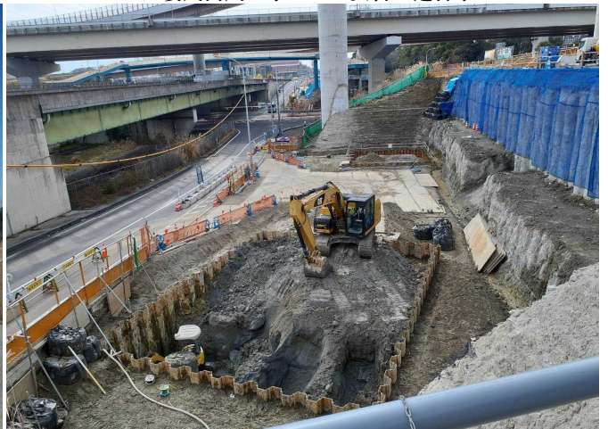
西知多道路(補強土壁撤去工事) ゼロ災害で進行中