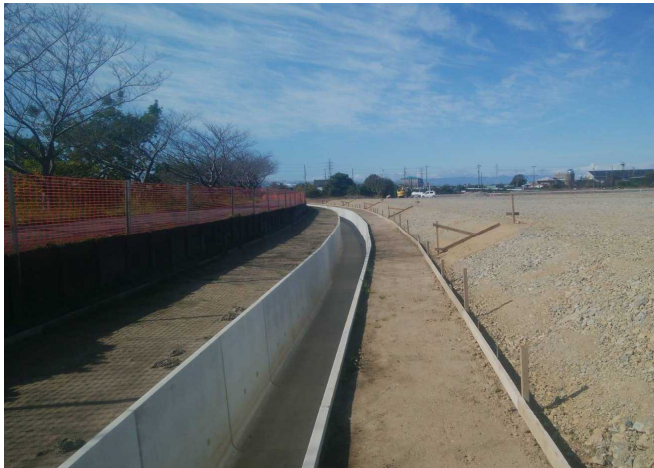
岩倉用地造成事業 ゼロ災害で進行中