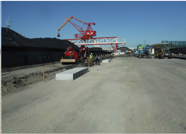
名古屋埠頭ヤード舗装工事 ゼロ災害で進行中