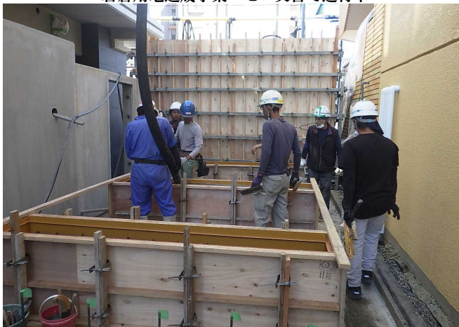
ブラセオン稲沢外構工事 ゼロ災害で進行中