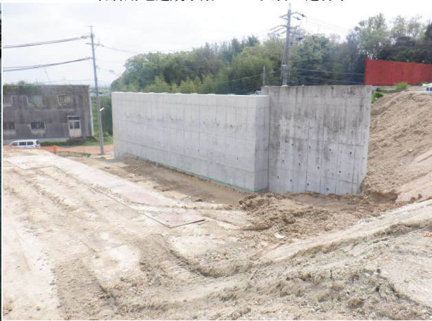
(株)カナザワ様 工場新築工事 ゼロ災害で進行中