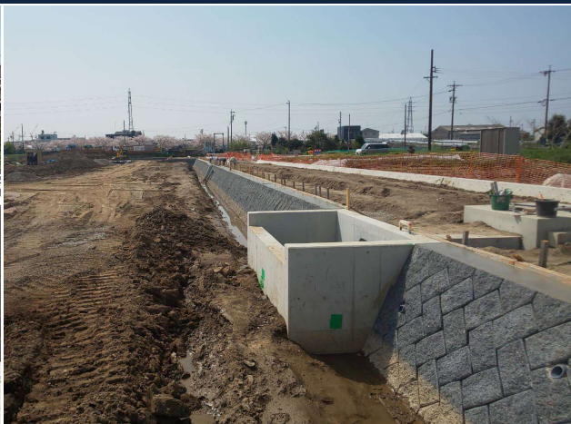
岩倉用地造成事業 ゼロ災害で進行中