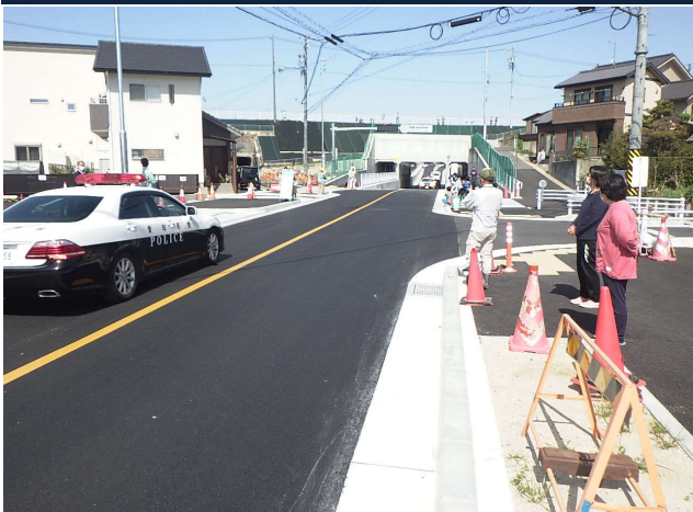
桶狭間勅使線道路改良工事 開通式