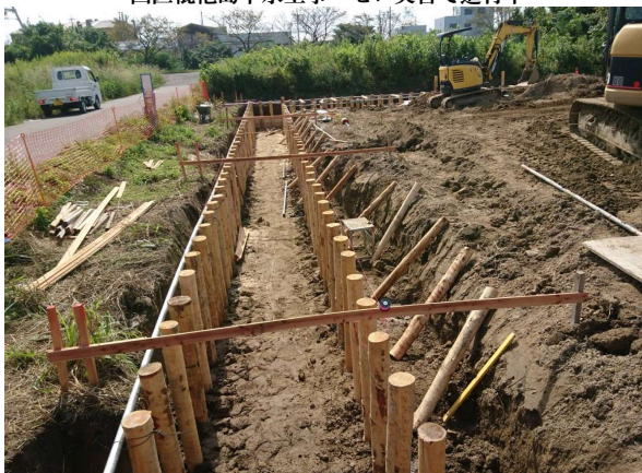
岩倉用地造成事業 ゼロ災害で進行中