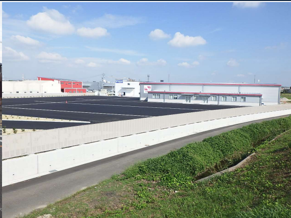
南星キャリックス様 ゼロ災害で進行中