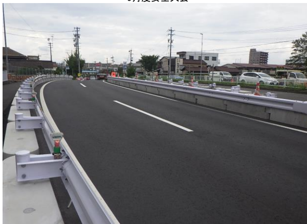
港東橋補強工事 ゼロ災害で進行中