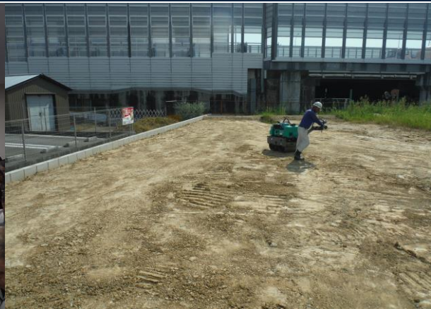
大高瀬木南土地区画整備事業 ゼロ災害で進行中