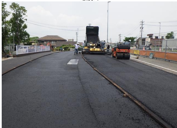
港東橋耐震工事 ゼロ災害で進行中