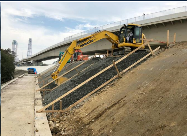
霞ヶ浦埠頭 ゼロ災害で進行中