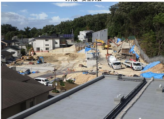
平和ヶ丘造成 安全作業で進行中