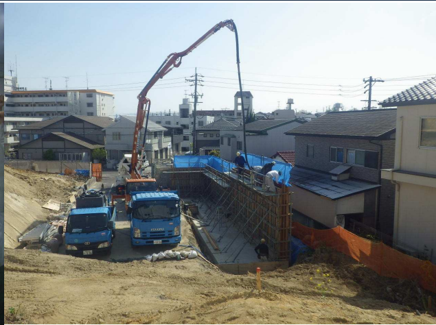
平和が丘一丁目造成 ゼロ災害で進行中