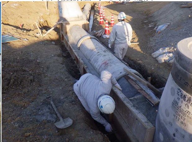
大高瀬木南土地区画整理事業 ゼロ災害で進行中