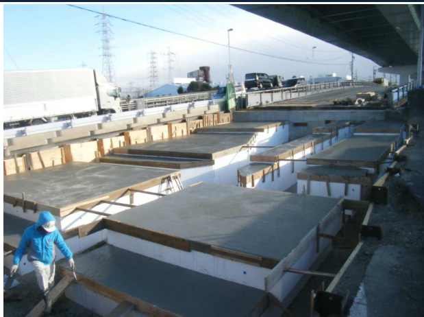
大津町線開橋改築工事 ゼロ災害で進行中