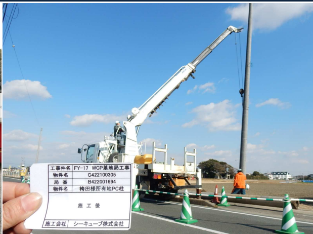
CCB(FY-17) ゼロ災害で進行中