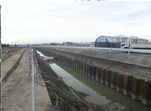
鵜戸川改修工事 ゼロ災害で進行中