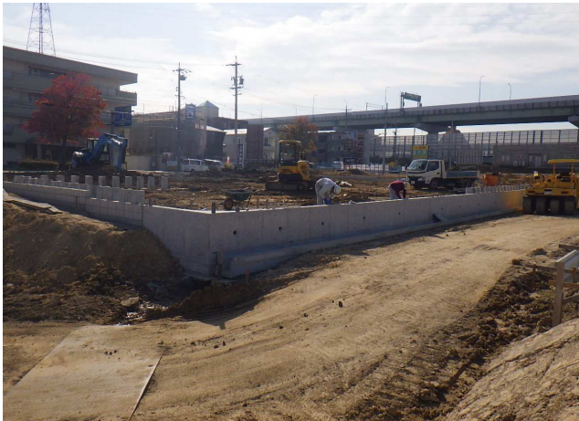
大高瀬木南土地区画整理事業 ゼロ災害で進行中