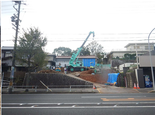
砦分譲 ゼロ災害で進行中